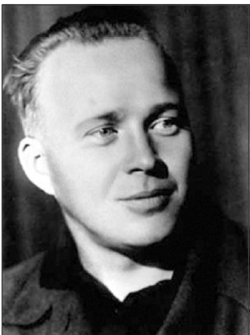
На младшем абонементе детской библиотеки оформлена книжная выставка «Судьбы и творчества страницы».

В январе 2019 года исполнилось 115 лет со дня рождения русского советского писателя Аркадия Гайдара (1904-1941 г.). Гайдар – литературный псевдоним Аркадия Петровича Голикова, автора многих широко известных среди детей произведений.